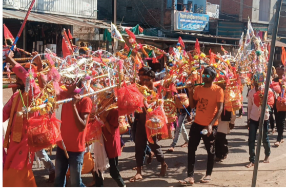
हरिभूमि न्यूज दमोह

भगवान शंकर की महाशिवरात्रि 8 मार्च को है महाशिवरात्रि पर्व आते है कावड़िया नर्मदा का जल भरकर पैदल चलकर अपने कंधे पर कावर में जलभरकर जागेश्वरनाथ की नगरी जल चढ़ाने बांदकपुर के लिए जाते हैं। देव श्री जागेश्वर नाथ धाम को पहुंचने वाली सड़कों पर इन दिनों बोल बम, जय भोले की गूंज सुनाई दे रही है। दिनभर भगवा वस्त्रों को धारण कर कावड़ लेकर कावड़ियों यात्रियों का आना-जाना बना हुआ है। हर वर्ष की तरह इस वर्ष भी रौंड़ बनवार बम्होरी अंचल से हजारों की